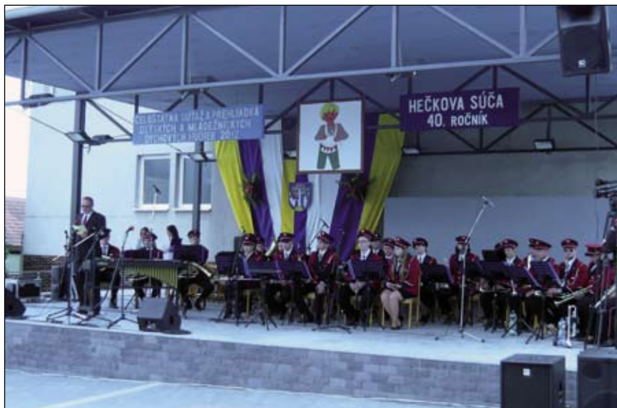
Celoštátna súťažná prehliadka detských a mládežníckych dychových hudieb Hečkova Súča • 2. 6. 2012 • Dolná Súča